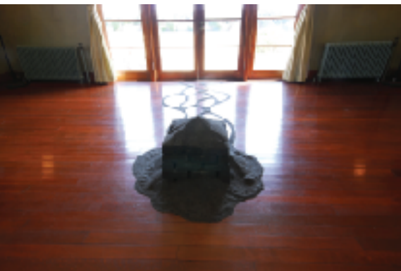
この部屋に海を連れてきた。