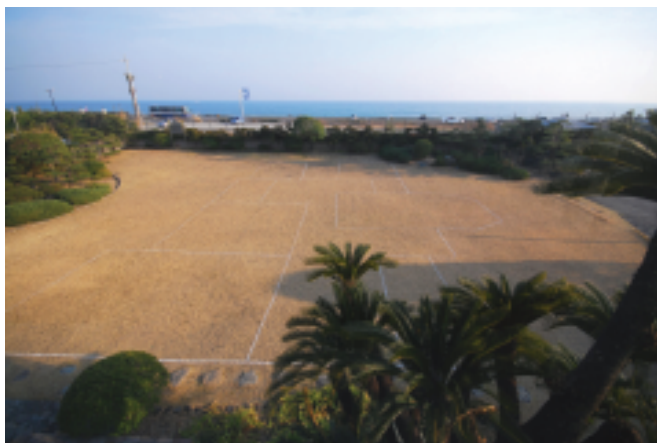
伊勢神宮の遷宮にコンセプトを置き、 再生と伝承を実寸で、 マッケンジー邸のサイズを庭に移想しました。